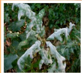
Neovectaria glabra / Agropyron / Phaeo / Glycerhiza

Ciencia y técnica frente a riesgos globales: coordinación y complementariedad