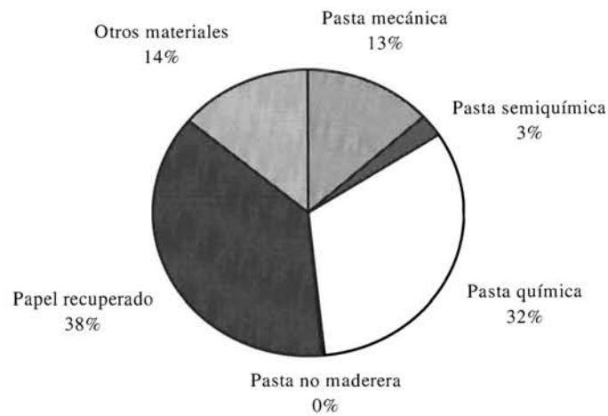
Figura nº 1. Consumo de materias primas en la fabricación de papel y cartón en la UE. 1994.

PULP & PAPER INTERNATIONAL. 1996. Vol. 38 nº 3.