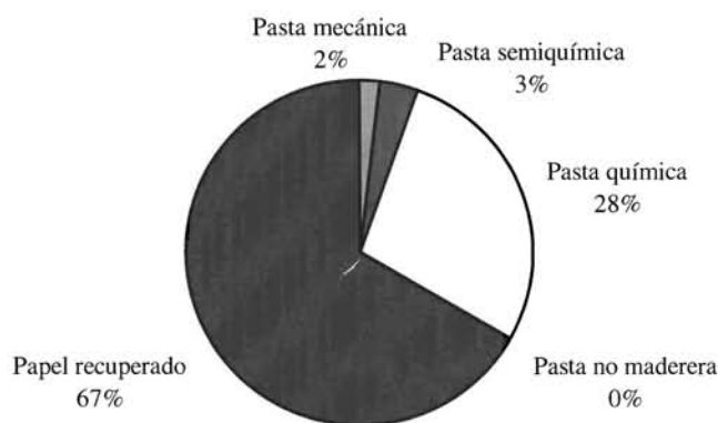
Figura nº 3. Consumo de materias primas en la fabricación de papel y cartón en España. 1994.