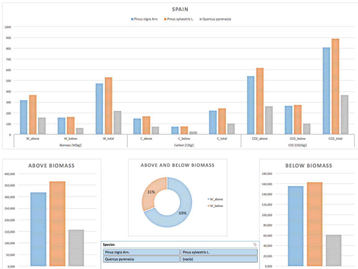
Figura 6. Pantalla de resultados gráficos (OUTPUT) generados por quantC a partir del inventario forestal definido por el usuario (INPUT) para el país/países de trabajo