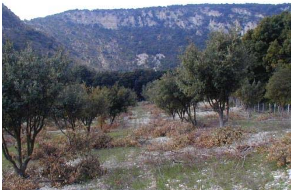
Figura 3. Trufera en las faldas de las Sierra de Lóquiz. Aspecto de la poda de las encinas y levantamiento de los avellanos para favorecer la insolación del terreno (con 15 años).