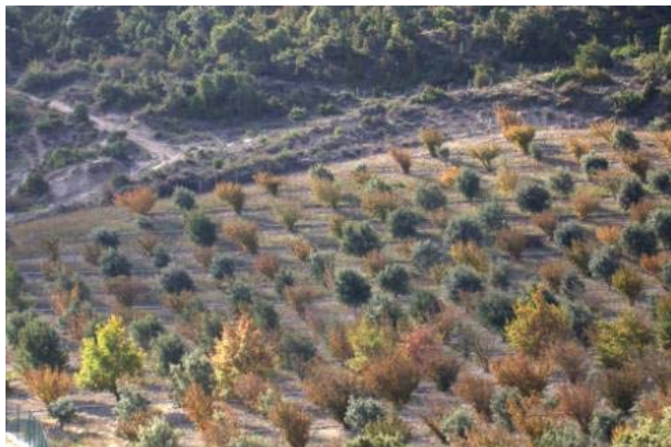
Figura 1. Trufera de Navarra: plantación mixta de encinas robles y avellanos, con 12 años.