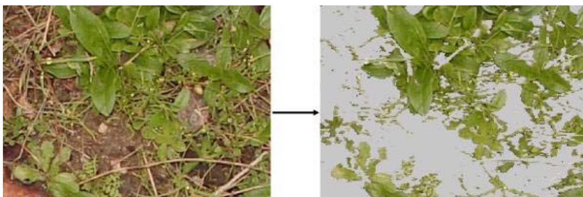
Figura 1. Separación de verdes en una imagen digital aplicando el índice RG con un umbral de 4. La cobertura del herbazal en la foto es de un 50,4%.